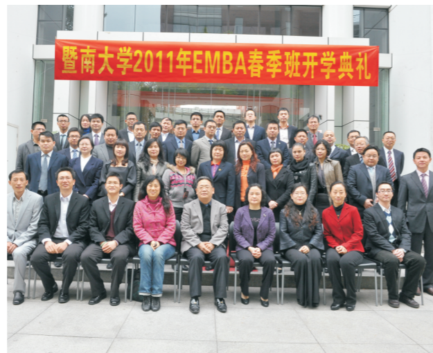
2011年春季班高级管理人员工商管理硕士开学典礼