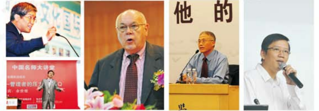
华商管理论坛上的大师们：依次为朗咸平、余世维、唐·舒尔茨、马鼎盛、吴晓波